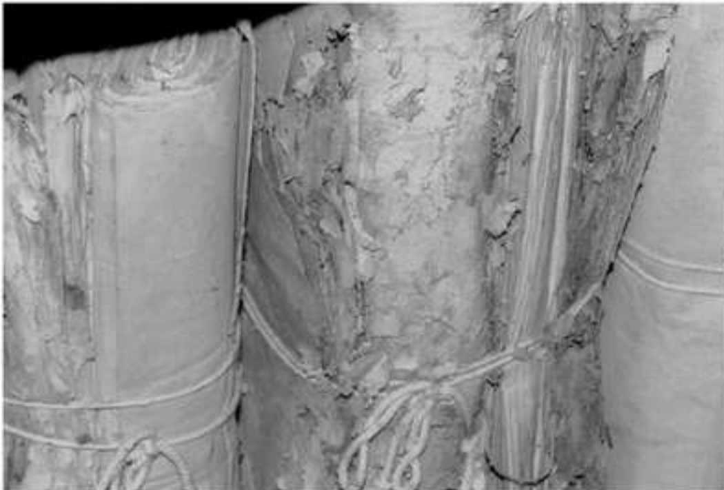
Εικόνα 5: Ο σπάγκος της περιδέσεως προκαλεί ανεπανόρθωτη ζημιά σε ευαίσθητο υλικό.

Ενδεδειγμένες λύσεις υπάρχουν: η αγορά έτοιμων φακέλων από αρχειακά μη όξινα υλικά ή η κατασκευή επί τόπου αρχειακών φακέλων και κουτιών. Προτείνονται διάφοροι τύποι κατασκευών με διαφορετικές λειτουργικότητες, προδιαγραφές, αποτελεσματικότητα και κόστος. Η περιγραφή τους ξεφεύγει από το πλαίσιο της εργασίας αυτής και θα αποτελέσει το αποκλειστικό θέμα επόμενης δημοσίευσης. Εδώ απλώς θα αναφέρουμε ότι: