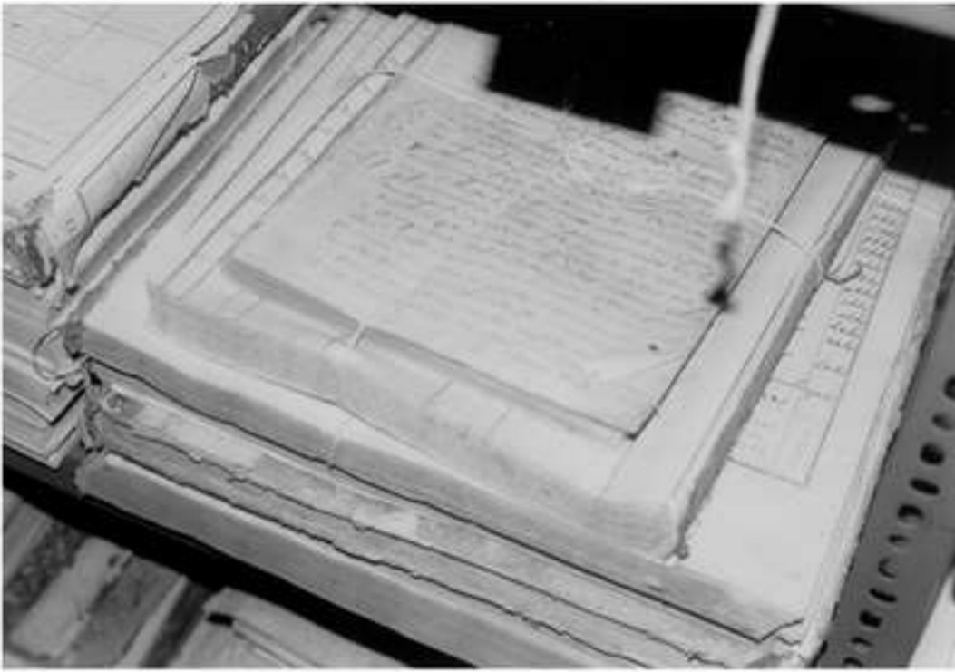
Εικόνα 4: Καταστρεπτικές περιδέσεις αρχειακού υλικού.

Ενδεδειγμένες λύσεις υπάρχουν: η αγορά έτοιμων φακέλων από αρχειακά μη όξινα υλικά ή η κατασκευή επί τόπου αρχειακών φακέλων και κουτιών. Προτείνονται διάφοροι τύποι κατασκευών με διαφορετικές λειτουργικότητες, προδιαγραφές, αποτελεσματικότητα και κόστος. Η περιγραφή τους ξεφεύγει από το πλαίσιο της εργασίας αυτής και θα αποτελέσει το αποκλειστικό θέμα επόμενης δημοσίευσης. Εδώ απλώς θα αναφέρουμε ότι: