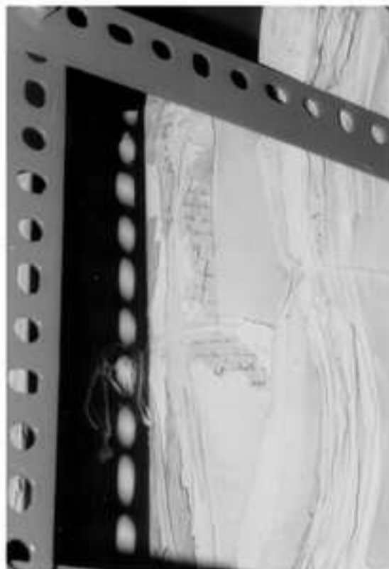
Εικόνα 6: Καταστρεπτική περίδεση