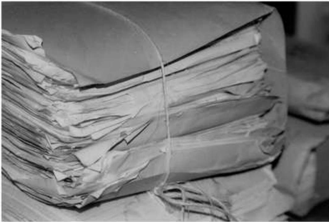
Εικόνα 7: Καταστρεπτική περίδεση